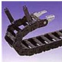
外周側開閉タイプ (標準タイプ)

アームは左右どちらからでも開閉可能です。また、内周側開閉タイプも用意しております。