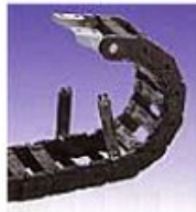
内周側開閉タイプ